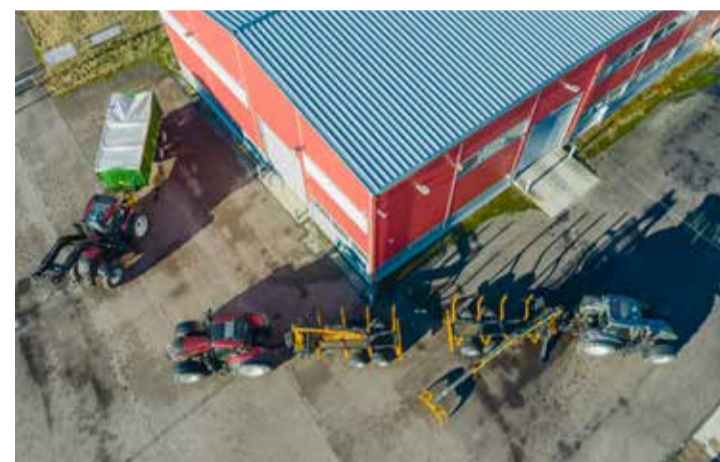
Mõned komplektid on Uulu tehнопargis müügiplatsil alati tutvumiseks saadaval.