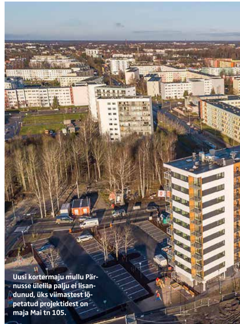
Uusi kortermaju mullu Pärnusse üleliia palju ei lisandunud, üks viimastest lõpetatud projektidest on maja Mai tn 105.

Nii nagu teisteski Eesti piirkondades, on ka Pärnu linnas olnud märgata nooremapoolsete ostjate huvi kasvu. Võrdlemisi kiirelt tõusnud korterihinnad, kuid samal ajal üsna kõrge majandusliku kindlustunde taustal on sagenenud noorte seas oma