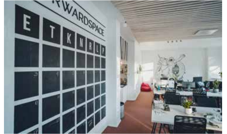
Koostöökontori kaudu on Pärnus tekkinud juba rohkem kui sadat inimest koondav ettevõtjate kogukond, kes ühisest tegutsemisest rõõmu leiavad.

Ta räägib, et tarvis on välja kuulutada mitu hanget ja koostöö peab sujuma nii Tartu ülikooli, arenduskeskuse kui ka Pärnu linnavalitsuse vaatevinklist, ruumide ehitamist korraldab Pärnumaa arenduskeskus.